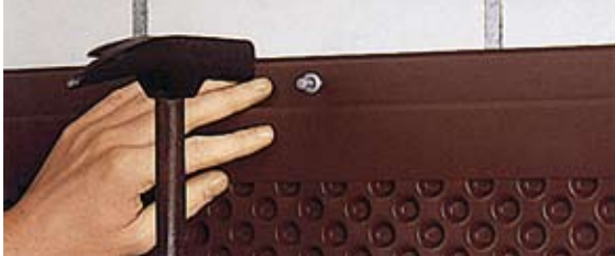
DELTA®-MS-PROFIL jako zakończenie górnej krawędzi.