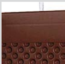
DELTA®-MS PROFIL Profil wieńczący górną krawędź.

Dörken czyni Wasze życie łatwiejszym. Systemowo. Dlatego zaskoczą Was praktyczne akcesoria DELTA®: