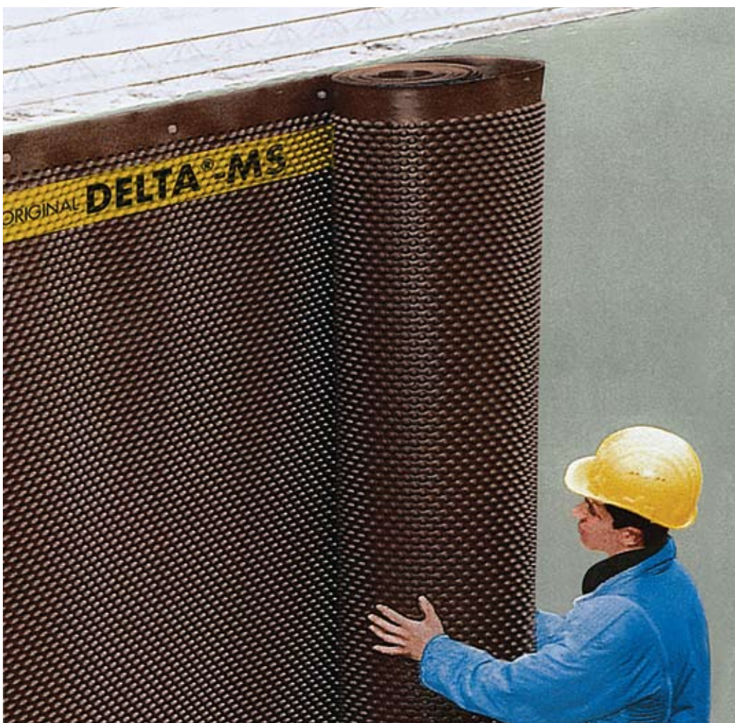
DELTA®-MS może być łatwo ułożona i zapewnia bezpieczną ochronę fundamentów.