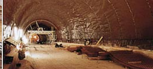
Wydajny drenaż powierzchniowy w tunelach.