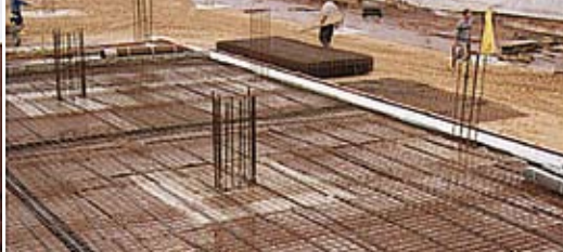
Bezpieczna warstwa bazowa pod płyty podwalinowe.