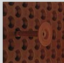
DELTA®-MS DYBEL Kotek rozporowy z tworzywa sztucznego do montażu.