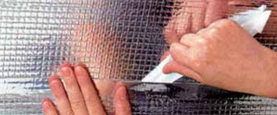
DELTA®-REFLEX PLUS ze zintegrowanym paskiem klejącym.