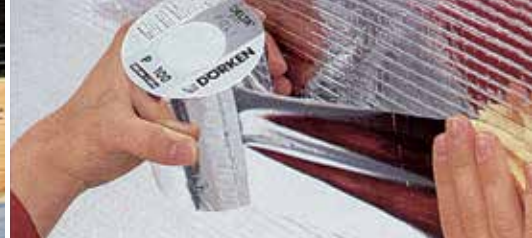
Łatwy montaż za sprawą produktów DELTA® System.