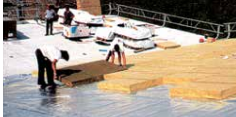
Zastosowanie na lekkich dachach przemysłowych.