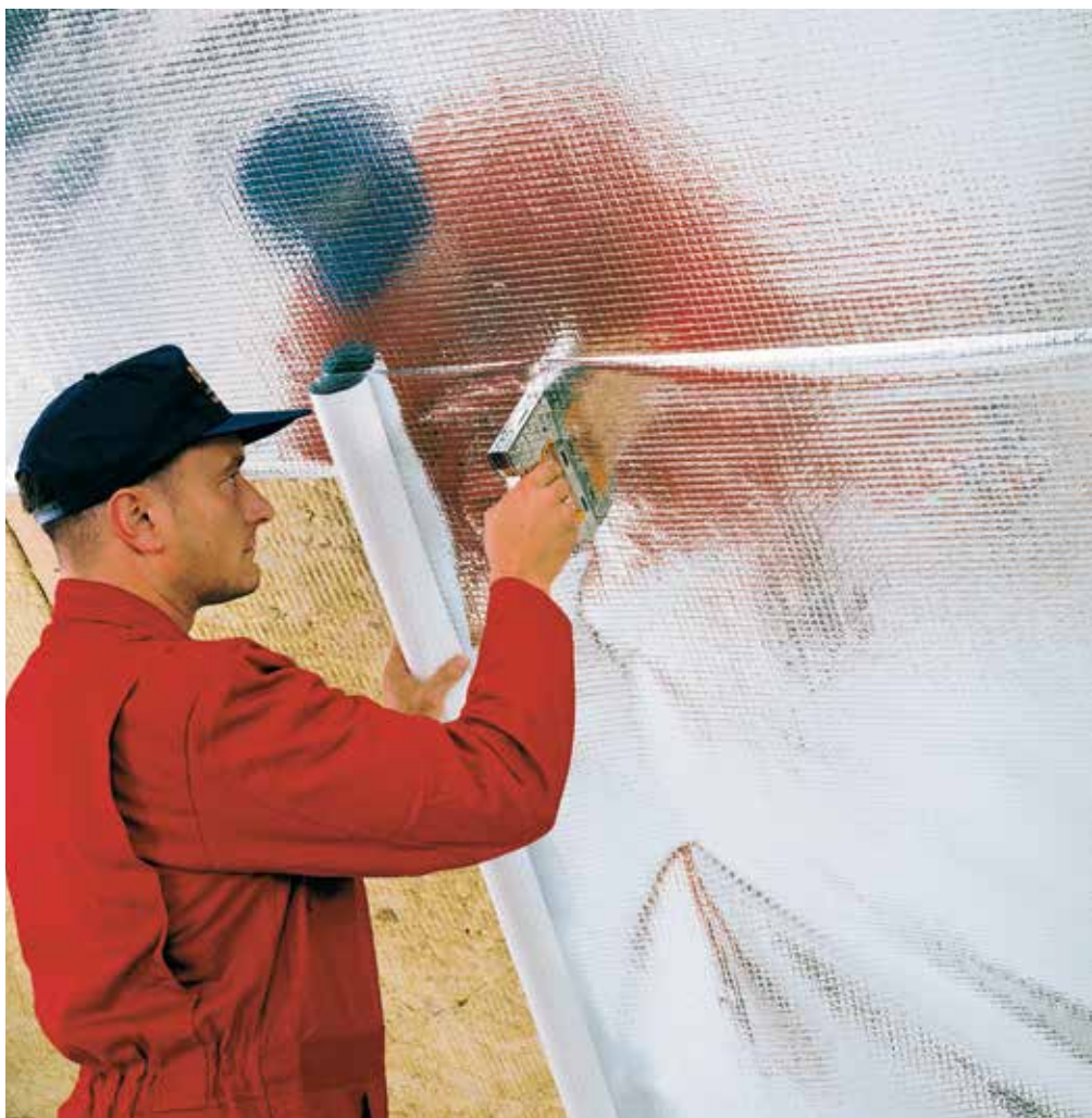
DELTA®-REFLEX - uniwersalna wiatro- i paroizolacja.