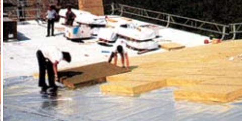
Zastosowanie na lekkich dachach przemysłowych.