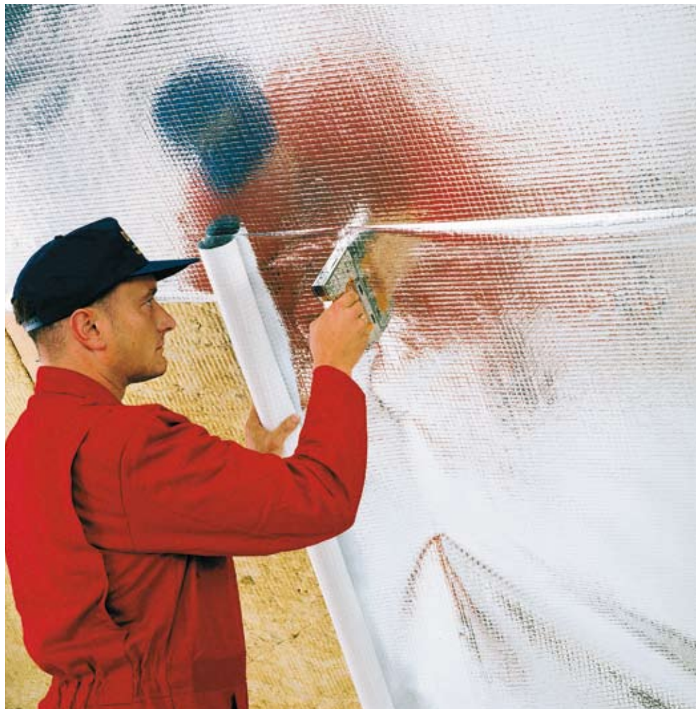
DELTA®-REFLEX - uniwersalna wiatro- i paroizolacja.