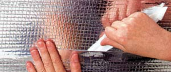
DELTA®-REFLEX PLUS ze zintegrowanym paskiem klejącym.