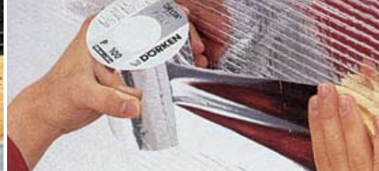
Lekkie układanie z komponentami systemowymi DELTA®.