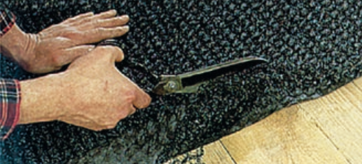
Proste i szybkie układanie.