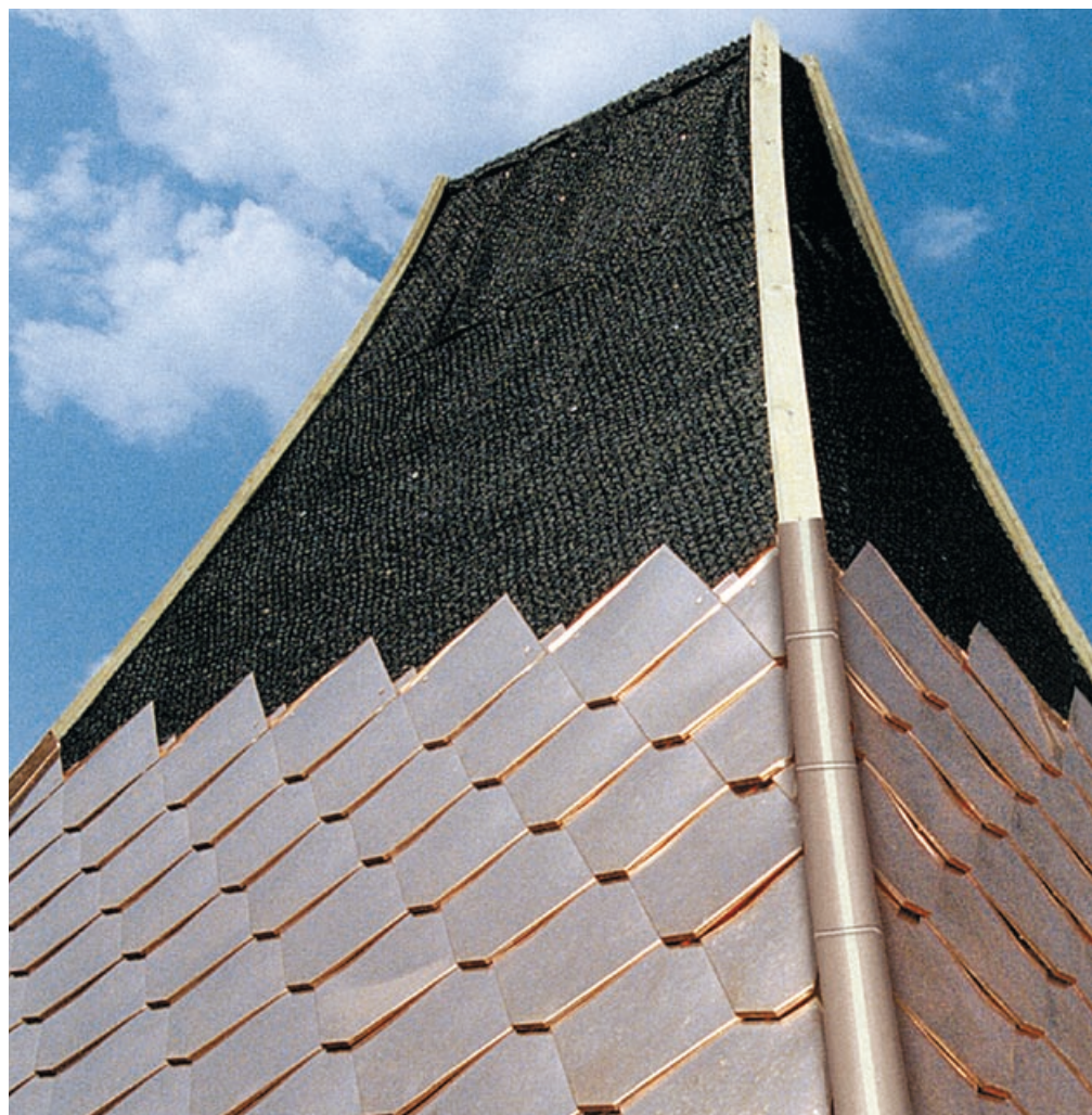
DELTA®-TRELA jest optymalną warstwą dzielącą dla metalowych dachów.