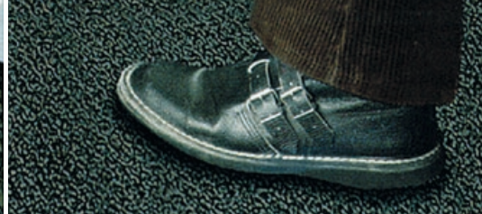
Struktura profilowana odporna na chodzenie.