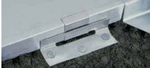
Umożliwia przesuwanie się brytów.