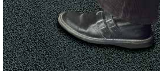
Struktura profilowana odporna na chodzenie.