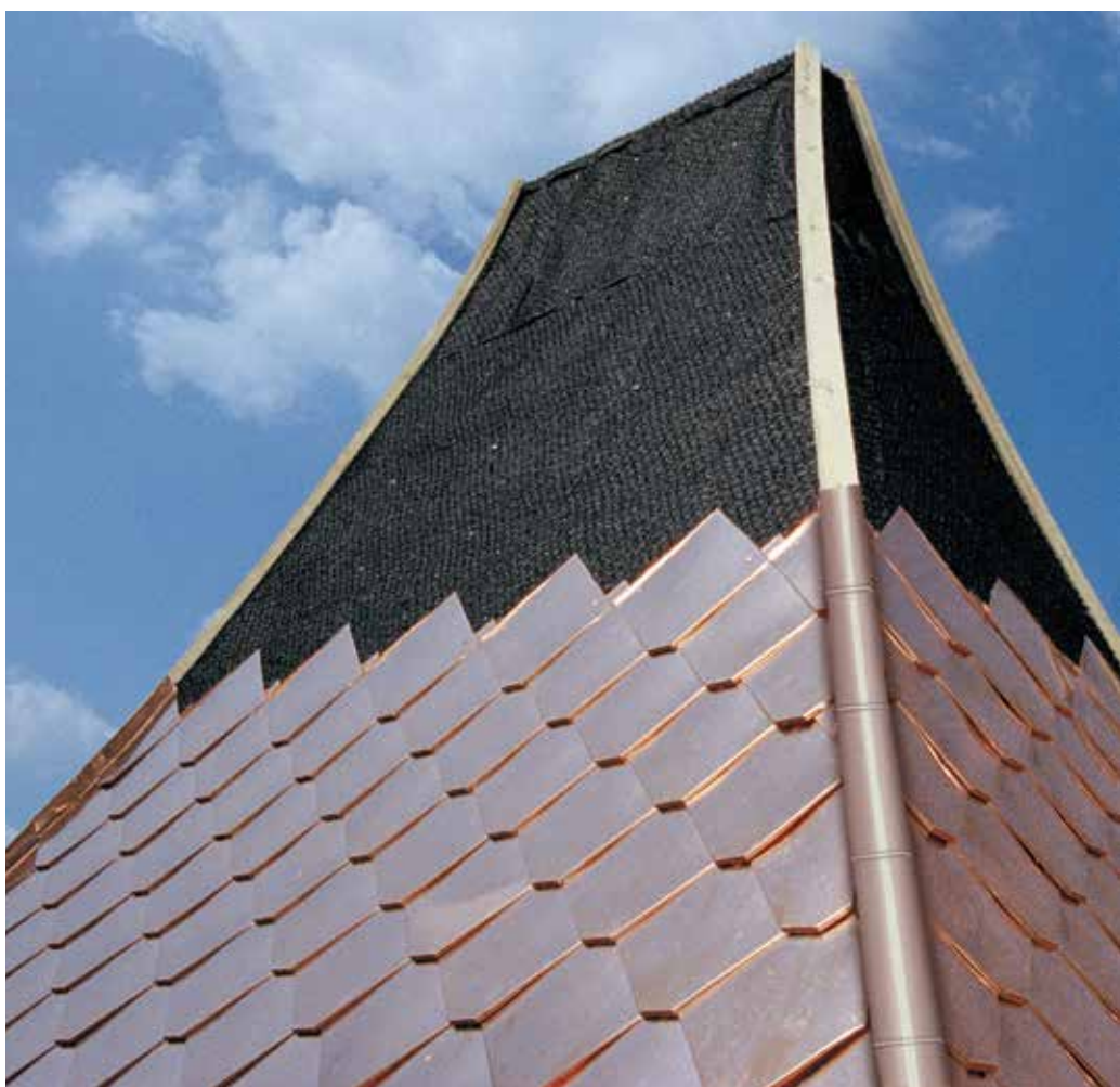
DELTA®-TRELA jest optymalną warstwą dzielącą dla metalowych dachów.

... DELTA®-ENKA VENT strukturalna, profilowana mata dzieląca bez folii nośnej.