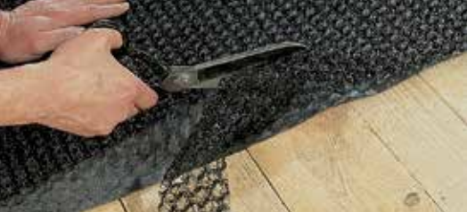
Proste i szybkie układanie.