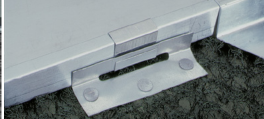
Umożliwia przesuwanie się brytów.