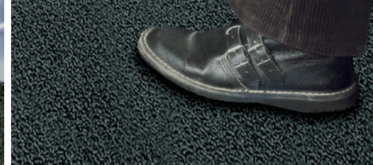
Struktura profilowana odporna na chodzenie.