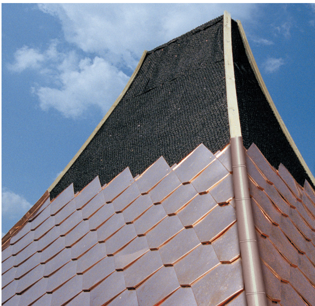
DELTA®-TRELA jest optymalną warstwą dzielącą dla metalowych dachów.

... DELTA®-ENKA VENT strukturalna, profilowana mata dzieląca bez folii nośnej.