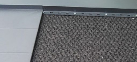
Odpowiednia pod pokrycia stalowe „na klik”