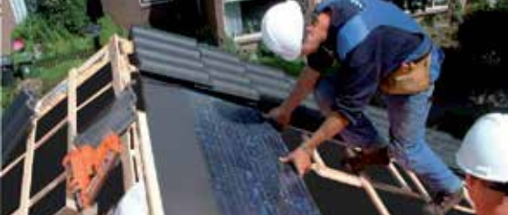
Pewne układanie na dachu spadzistym lub elewacji.