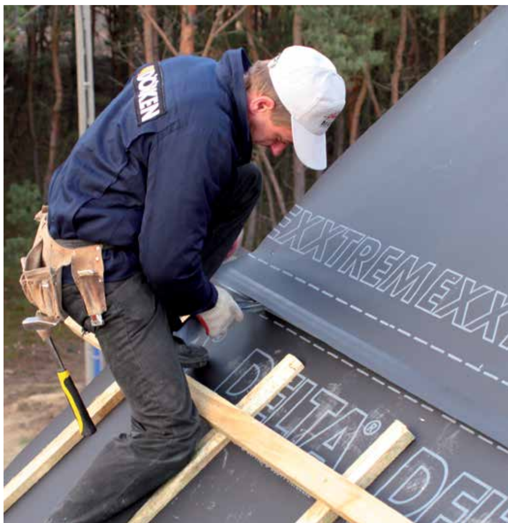
DELTA®-EXXTREM znajduje zastosowanie na wentylowanych lub niewentylowanych konstrukcjach dachowych.