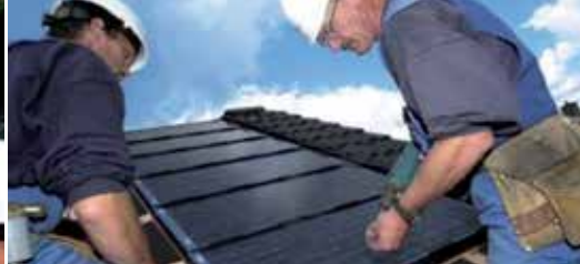
Szybkie układanie, zgodnie z wytycznymi.