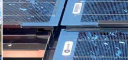
Optymalne przy panelach fotowoltaicznych i solarnych.